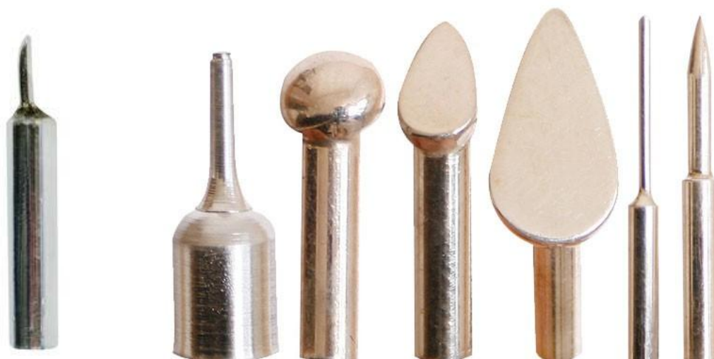
Set stříbrných minišpiček s adaptérem pro upevnění na 1EM

Všechny uvedené ceny jsou bez DPH a přepravních nákladů