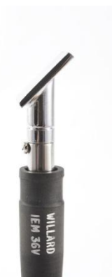
2702 002 Mini špachtle Ma 1.245,00