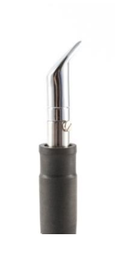
2702 012 Mini špachtle Mf 1.245,00