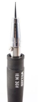
2702 014 Mini špička Mg 1.245,00