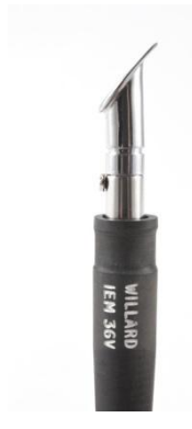
2702 008 Mini špachtle Md 1.245,00