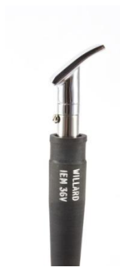
2702 004 Mini špachtle Mb 1.245,00