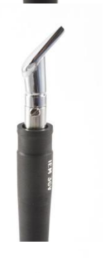
2702 010 Mini špachtle Me 1.245,00