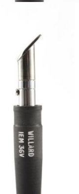
2702 006 Mini špachtle Mc 1.245,00